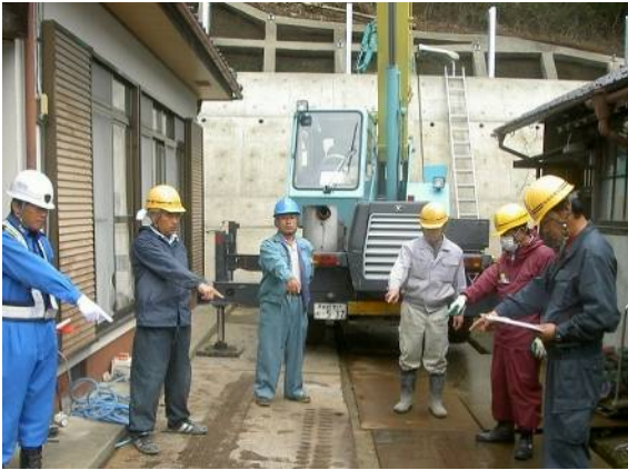
朝礼では、安全行動とともに騒音の抑制、急加速急発進の禁止も促します。もちろん後ろのクレーン車はアイドリングストップ中！