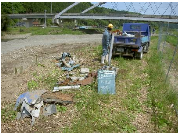
河川工事に入ったときに、ついでにゴミ掃除。