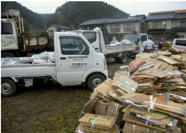
地域の方とともに。リサイクルの意識は高い