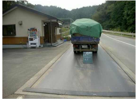
木くずは飛散して周辺を汚さないようにきちんとシートがけ。搬入先は、もちろん再生施設。木くずはここでチップになって次の役目をもらいます。