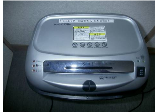
重要書類以外は再利用の上で再生に。 シール「シュレッダーにかけたたらただのゴミ！」