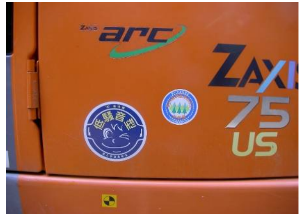
建設機械は低騒音型、排出ガス対策型。このステッカーが目印です。