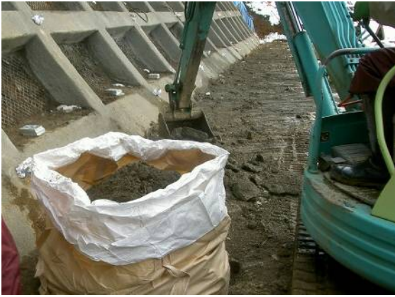
現場の土とモルタル殻が混じってしまわないように丁寧に集積します。重さは、この袋1つで1tにもなります。