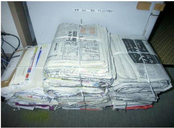
分別は まずは事務所から 「新聞 雑誌 公告 それぞれ別梱包」