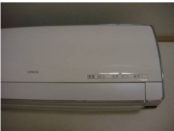
エアコン温度設定シール 「夏期28℃ 冬季20℃ 厳守！」