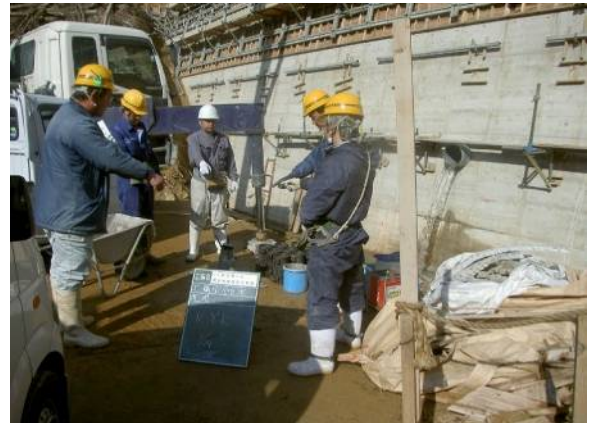
これも朝の風景。もちろん後ろのコンクリートポンプ車はアイドリングストップ中！