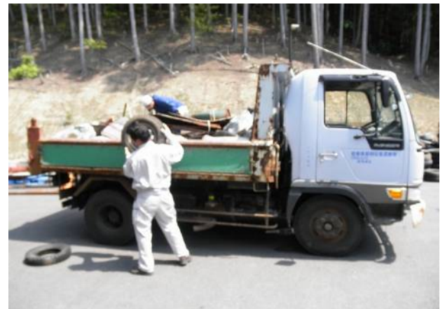
しかしそれにしても、投棄ゴミのバリエーションと 量の半端ないこと、、、。