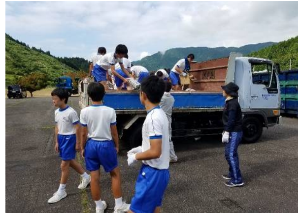
地域の中学校の資源回収をお手伝い