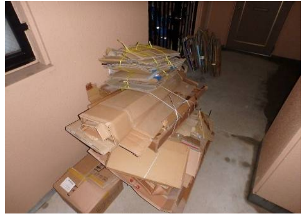
もちろん工事材料の梱包も今日まで大切に保管。