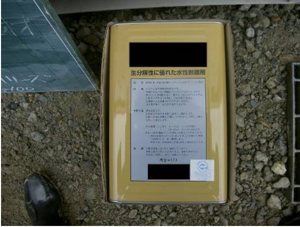
型枠剥離剤も環境配慮型製品を使用しています。「エコマーク」認定の有無は、資材選定の大きな基準になりますね。