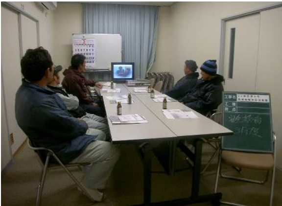
月一回ペースで行う安全衛生教育。災害発生時の避難方法や緊急連絡体制もここで伝えます。(この写真は冬季のもの。エアコンの温度を抑えているので全員ウォームビズで…。)