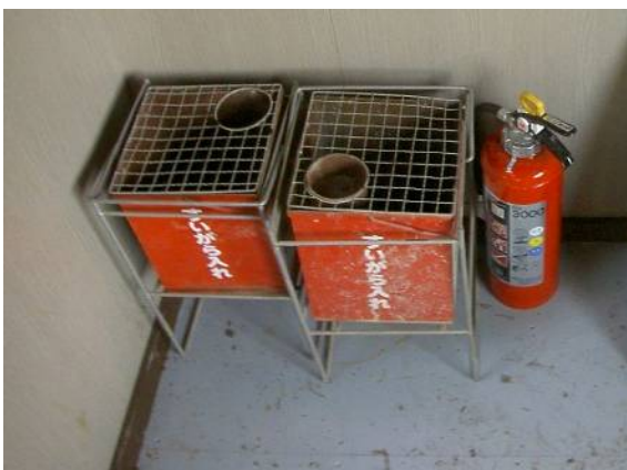
現場事務所には吸殻入れと消火器。朝、作業現場に出て行って夕方ここに帰ってきます。ポイ捨て厳禁！