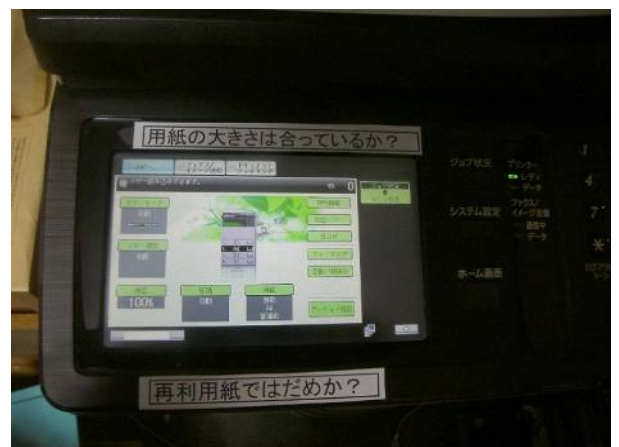
複合機シール 「用紙の大きさは合っているか?」 「再利用紙ではだめか?」