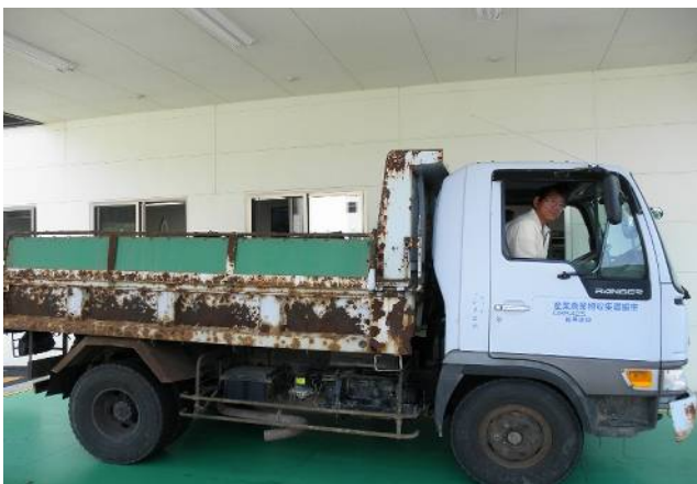
但馬5万人クリーン作戦へのボランティア参加。 南但クリーンセンターにて。