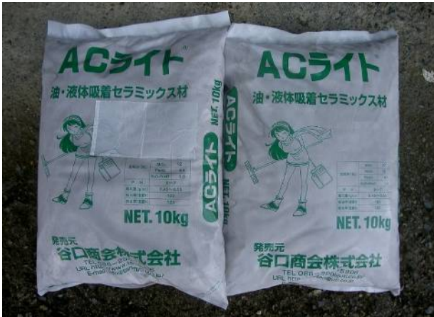
これは、不慮のオイル漏れなどで環境に悪影響を与えないための油水吸着剤 4000～5000円/袋 は少し高いな