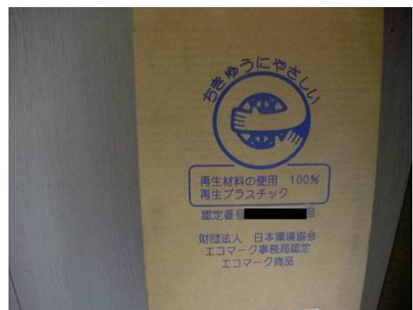
土木工事用製品にも、このような「地球にやさしい」製品がどんどん開発・提供されているんですね。我々も、もっと情報アンテナを張らないと・・・。