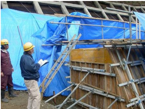
安全衛生パトロール風景。このとき、残材がきちんと片付いているか、産廃の分別状況、車輛や重機の整備状況などもチェックします。道路を汚していないか、埃がたっていないかなどもポイントです。