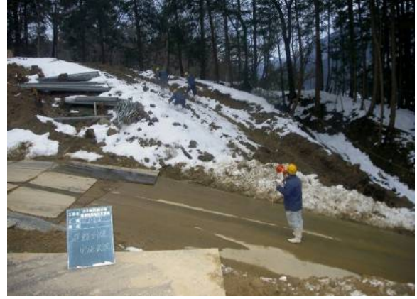
土石流対策避難訓練。定期的こんな訓練も行います。