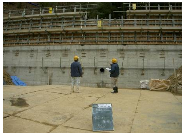
こちらも安全衛生パトロール。最初の測量から掘削、型枠組立、足場組立、溶接、生コン打設まで95%は自社直営です。安全は、まず整理整頓から。