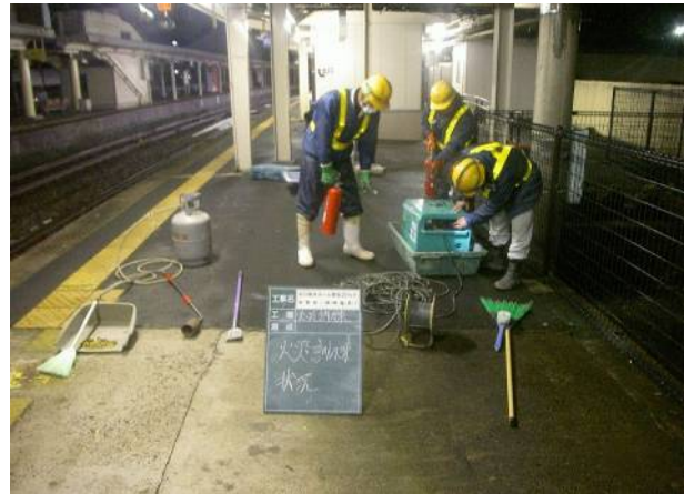
夜のプラットフォームで火災訓練。